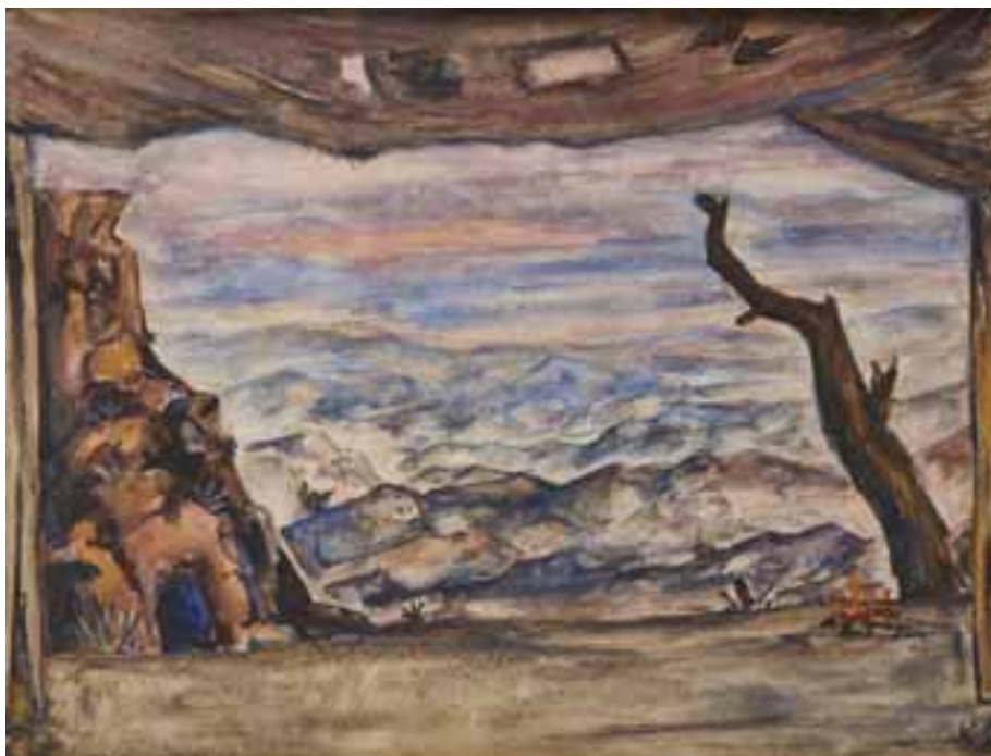
227 GONTCHAROVA Natalia (1881-1962) Etude de décor de théâtre Aquarelle gouachée, signée des initiales en bas à droite Haut. : 23,5 ; Larg. : 31,5 cm 2 000 / 3 000 €