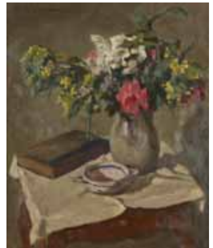
196 NAKAMARA K Bouquet Huile sur toile, signée en haut à gauche Haut. : 61 ; Larg. : 50 cm 120 / 150 €