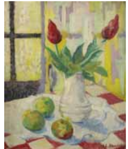
225 CALDO Bouquet Huile sur toile, signée en bas à gauche Haut. : 54 ; Larg. : 41 cm 150 / 180 €