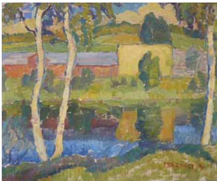
228 FERENCZY Korly (1862-1917) Nagybanyan Huile sur isorel, signée en bas à droite, située et contresignée au dos Haut. : 27,5 ; Larg. : 32,5 cm 1 000 / 1 200 €